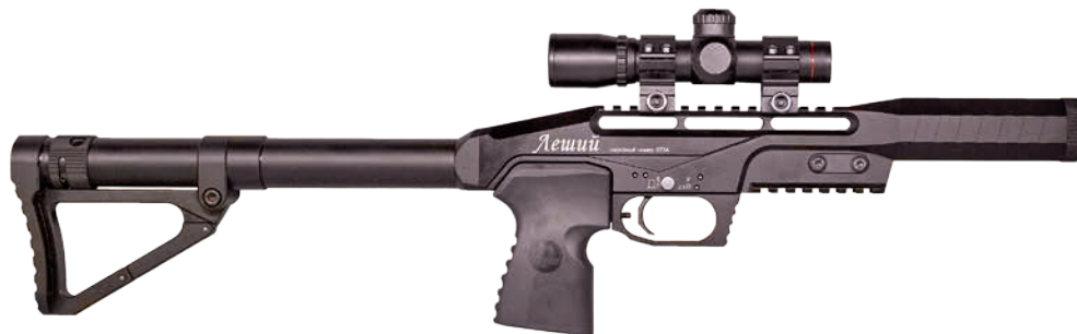
Пневматическая винтовка с предварительной накачкой «Леший»*